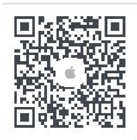
苹果客户端二维码