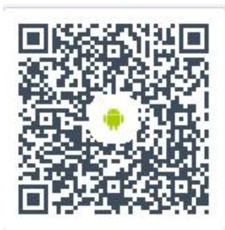
安卓客户端二维码